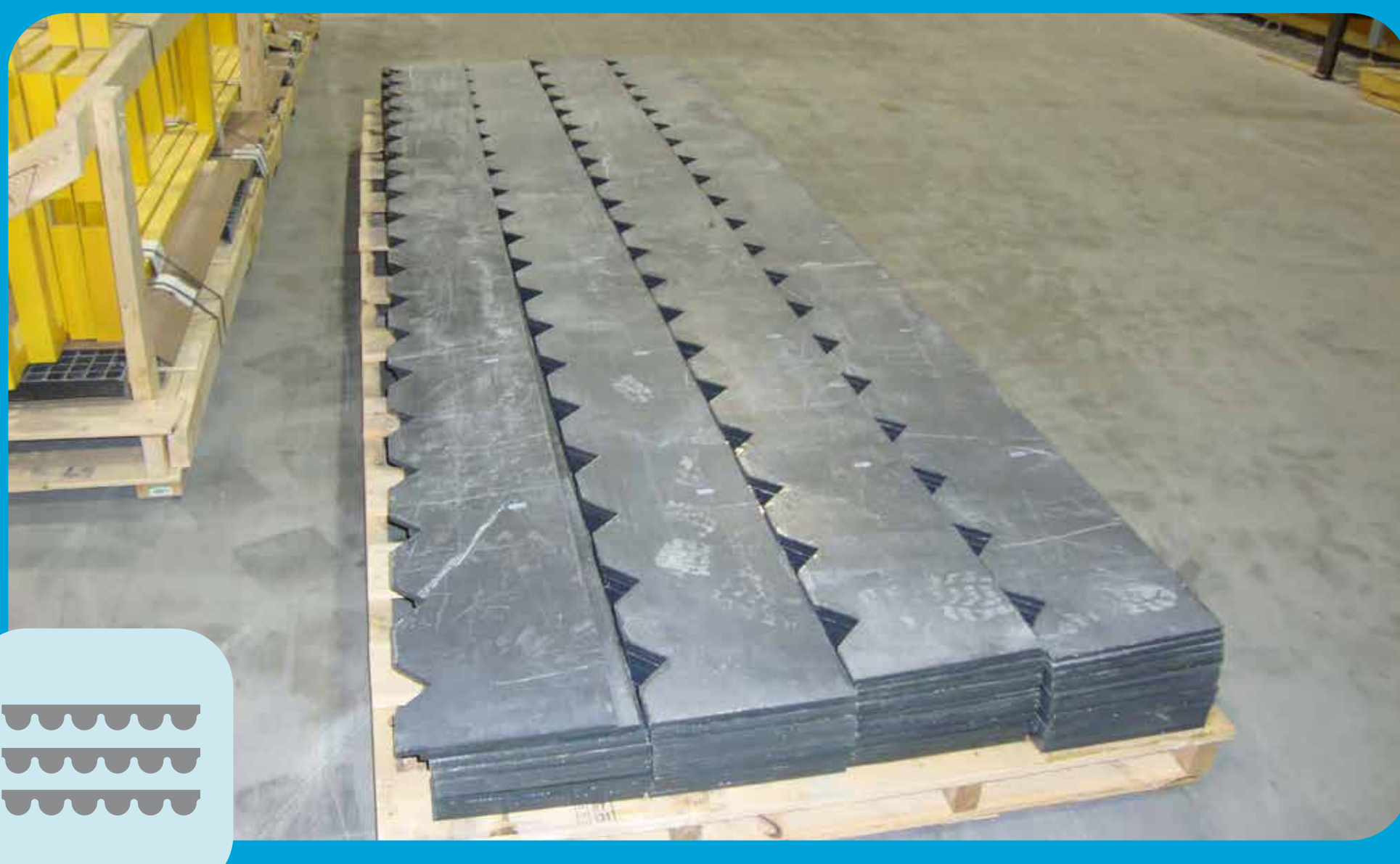
Placas Deflectoras y Vertederos