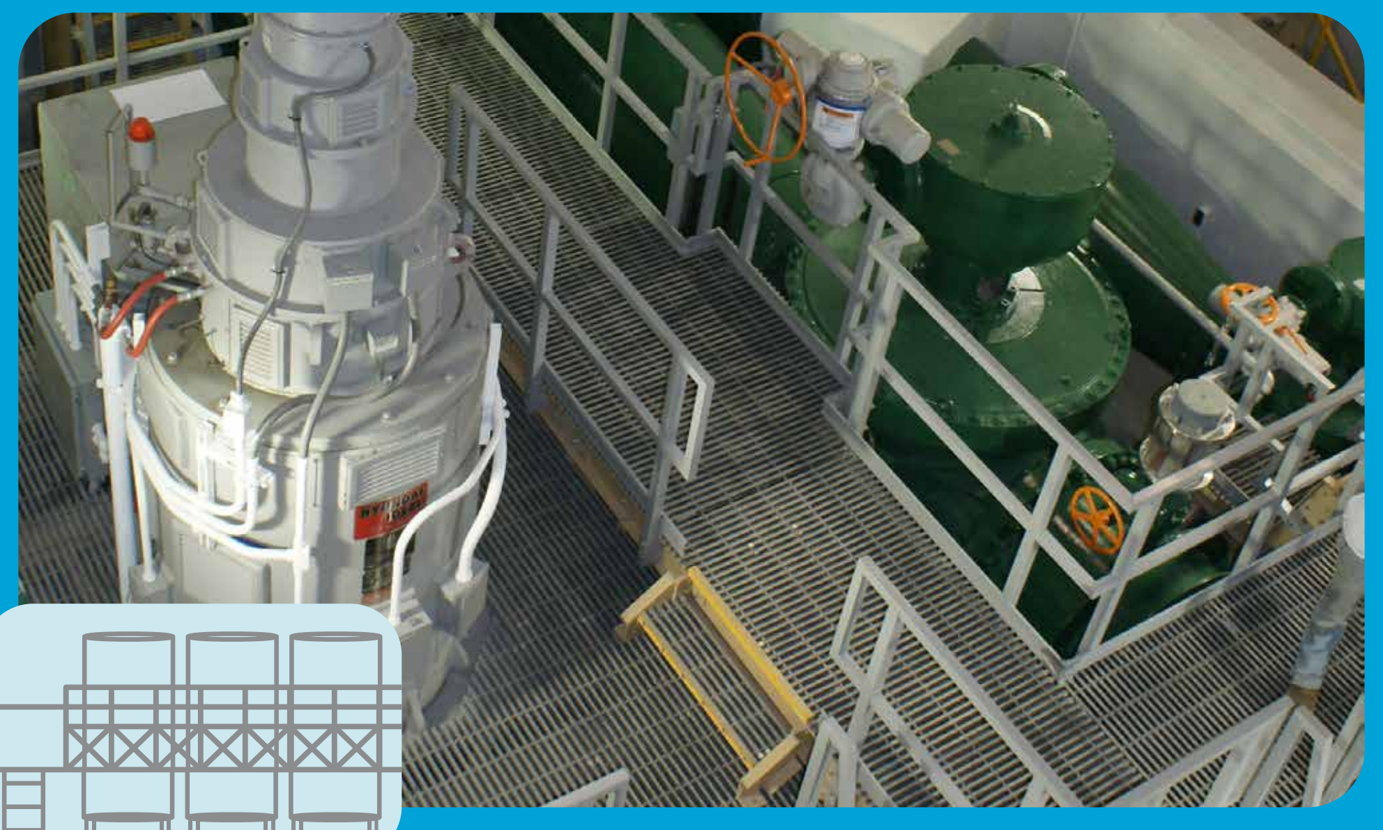
Estructuras de Soporte de Filtración