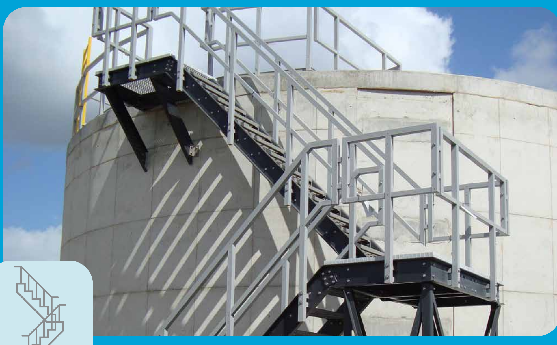
Plataformas de Acceso a Equipo y Tanques