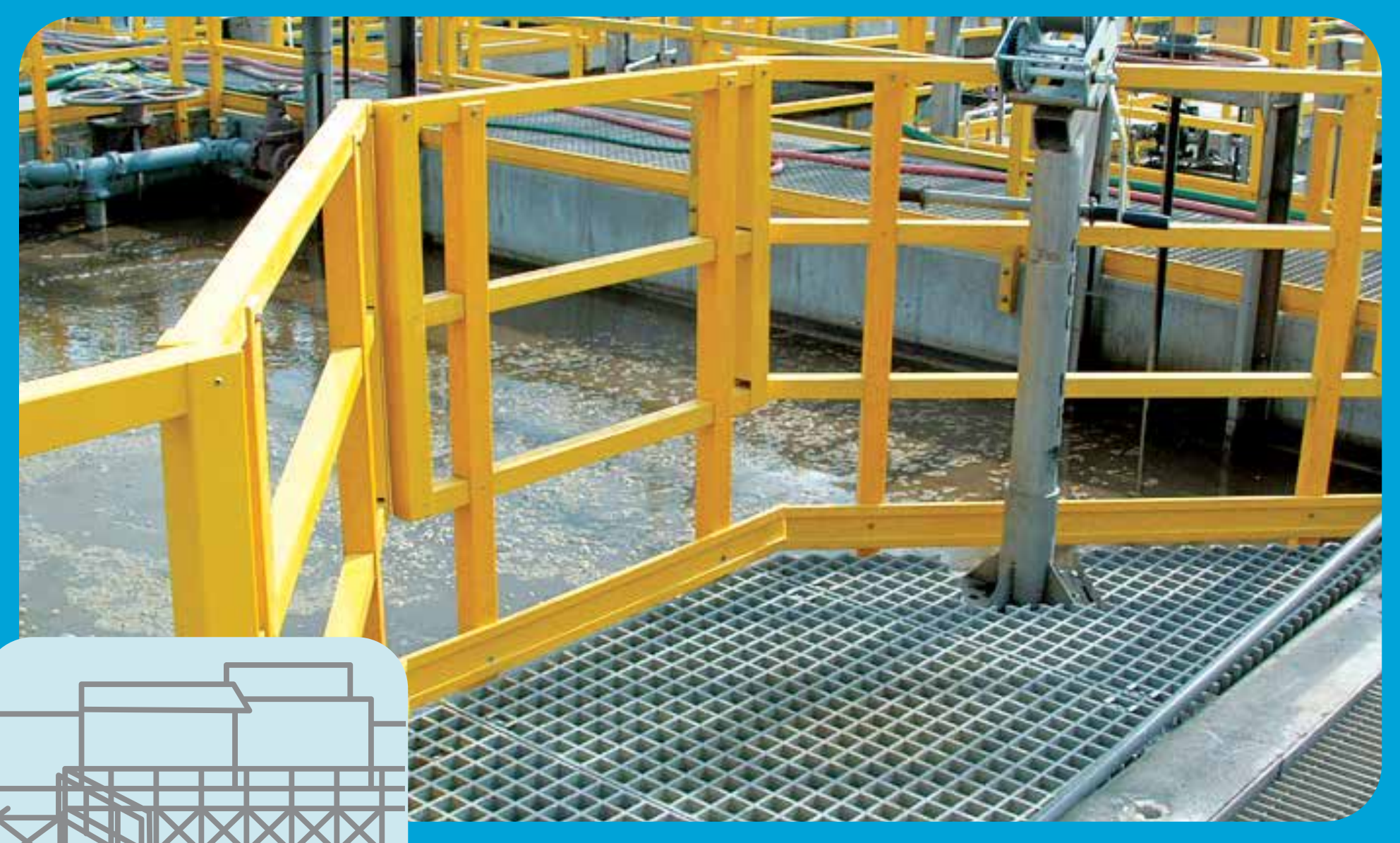
Barandales en Piletas y Clarificadores