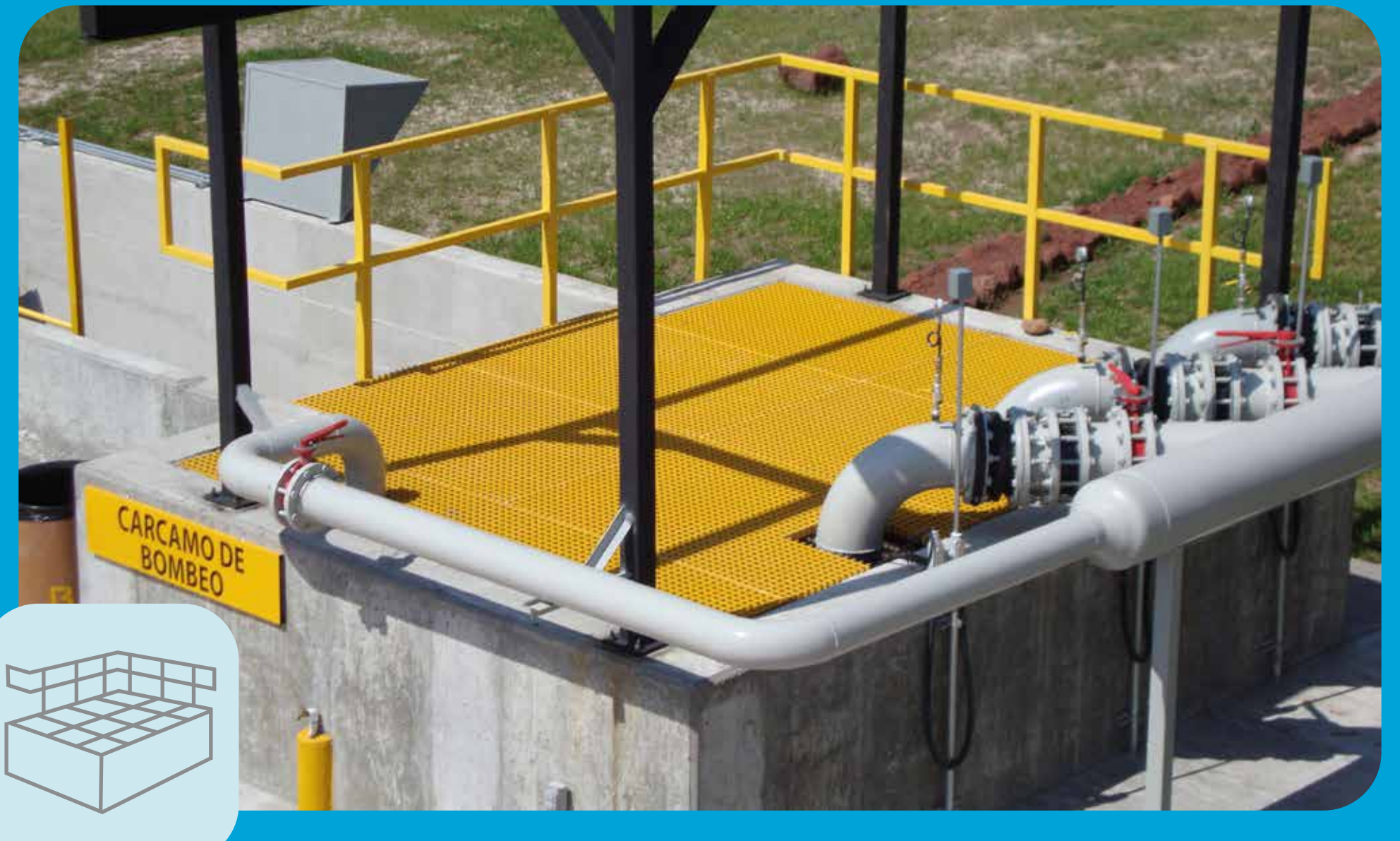
Cubiertas de Trincheras y Bóvedas

Los productos de Fibergrate se pueden encontrar en todas las fases de las instalaciones de tratamiento de agua potable y aguas residuales incluyendo filtración, las instalaciones de almacenamiento de agua y productos químicos y las zonas de recolección y tratamiento.