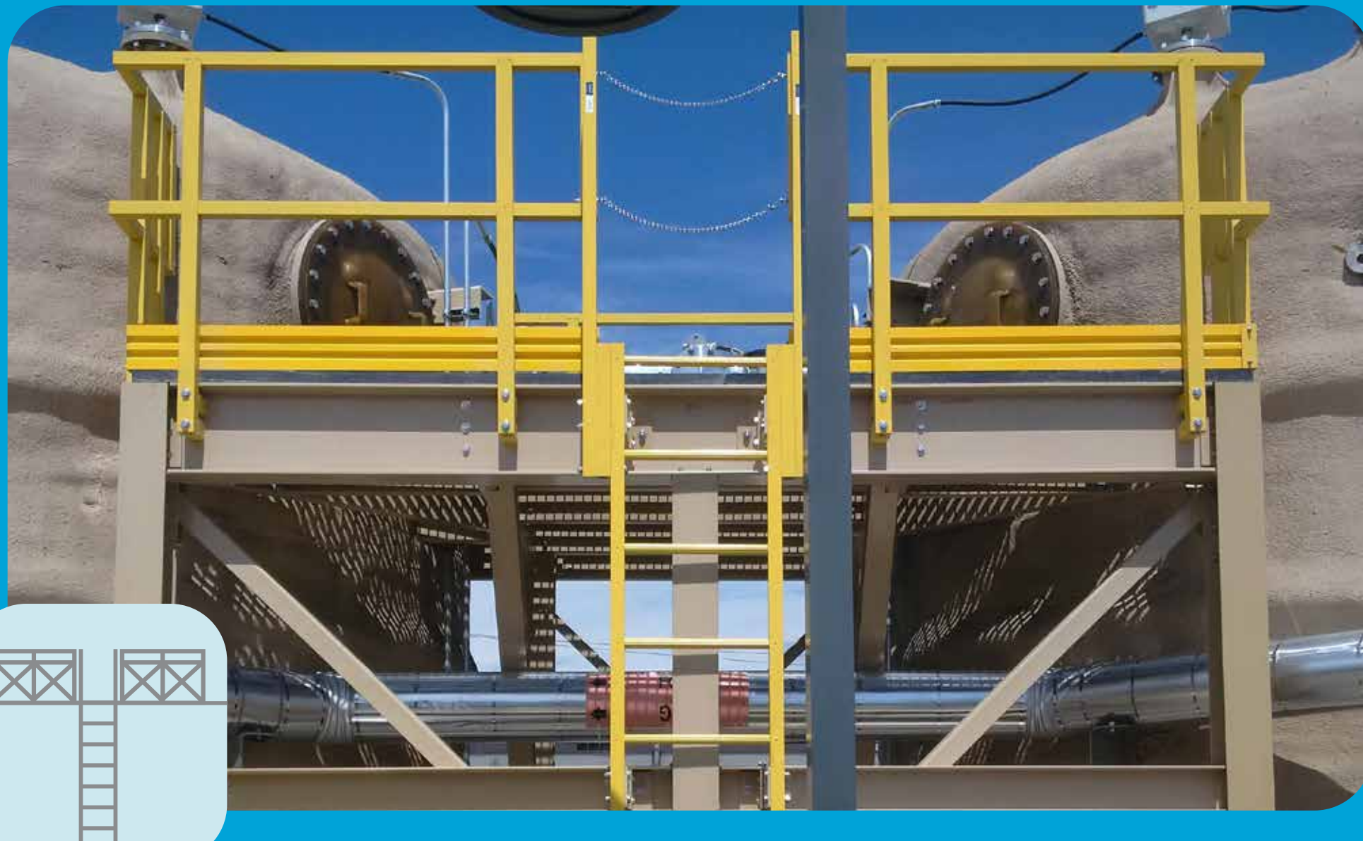
Escaleras y Escaleras Marinas